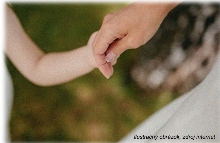
Ilustračný obrázok

PRISPEJTE AJ VY K SKVALITNENIU OBSAHU VAŠICH NOVÍN