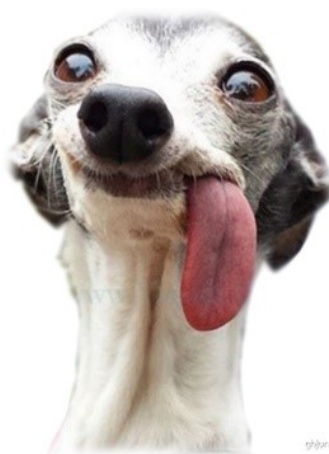
Ilustračný obrázok