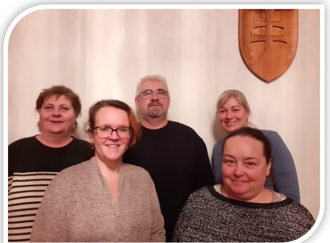
Foto novej redakčnej rady

PRISPEJTE AJ VY K SKVALITNENIU OBSAHU VAŠICH NOVÍN