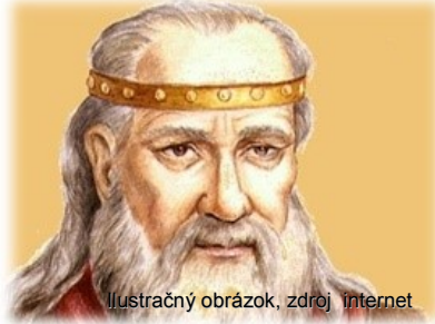
Ilustračný obrázok, zdroj: internet

Som Samo, franský kupec, dobrodruh a muž činu. Mám podnikavého ducha, som rozumný a rozvážny. Preto je logické, že mi napadlo využiť boje Slovanov a Avarov a zarobiť na nich. Získať hrivny a kovové prúty, ktoré sú v našom 7. storočí najvzácnejšie.