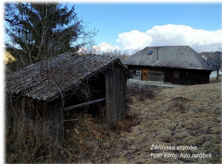
Žihľavská staroba

cestou budeme asi hodinu neustále stúpať do kopca. Nakoľko sa jedná o neznačenú cestu, na križovatkách musíte dávať pozor, aby ste vždy išli hore. Ak cesta za križovatkou klesá, vráťte sa. Väčšinou sa treba držať odbočiek vľavo. Nebojte sa, sú iba dve. Na konci stúpania sa lesná cesta mení na makadamovú a otvoria sa prvé výhľady na Žihľavu a vykrývač. Pokračujeme až ku bývalej škole a kaplnke, kde nás už čaká asfaltová cesta. Minieme Starú krčmu a môžeme sa zastaviť na cintoríne, z ktorého (hlavne stará časť) sála zaujímavá atmosféra na rozjímanie. Nad cintorínom prídeme ku drevenému križku a musíme zastať. Panoráma Nízkych Tatier ohúri každého. V popredí sú Látky, trochu vľavo Poľana, vpravo majestátno Bykovo.