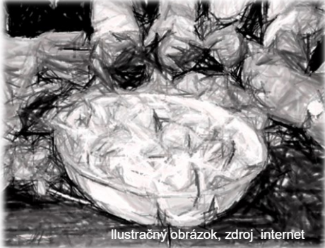
Ilustračný obrázok

Ženám vždy dobre padne, ak sa môžu stretnúť s kamarátkami, trochu sa porozprávať a zasmiať. Preto tak milujeme dámske jazdy, počas ktorých si oddýchneme a užijeme veľa zábavy.