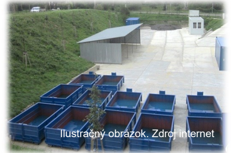
Ilustračný obrázok.