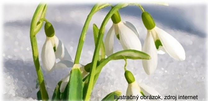
Ilustračný obrázok, zdroj internet

Obecný úrad vás spôsobom v obci obvyklým, najmä však prostredníctvom miestneho rozhlasu, facebookovej stránky obce, zverejnením na úradnej tabuli, resp. zasielaním SMS správ bude priebežne informovať o aktuálnych informáciách ohľadom práve prebiehajúceho sčítania obyvateľov.