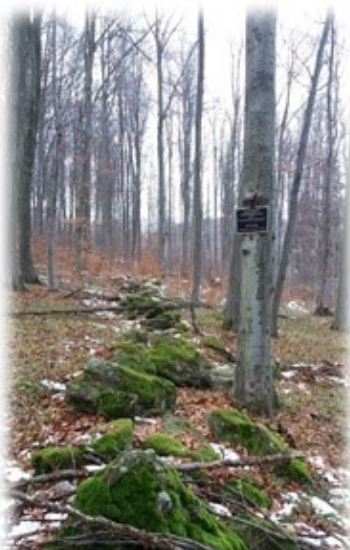
Pozostatky obranného valú Kyjatickej kultúry.