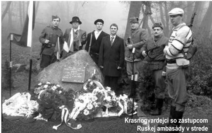
Krasnogvardejci so zástupcom Ruskej ambasády v strede

25. novembra 2016 sme si za prítomnosti hostí a domácich občanov pripomenuli udalosti spred 72 rokov, kedy aj na týchto miestach operovali partizánske oddiely počas II. svetovej vojny. Slávnostný akt odhalenia Pamätníka partizánskeho práporu 1. československej armády na Slovensku počas SNP iniciovala a organizovala Základná organizácia Slovenského zväzu protifašistických bojovníkov Cinobaňa v úzkej spolupráci s Obcou Cinobaňa. Spomienkového podujatia sa zúčastnil zástupca Ruskej ambasády, zástupcovia múzea SNP z BB a Novohradského múzea a galérie z LC, zástupcovia oblastných organizácií SZPB, členovia Klubu vojenskej histórie Krasnogvardejci z Košíc, vojaci z Rožňavy, zástupcovia Obce Cinobaňa, poslanci OZ, pamätníci a miestni obyvatelia.