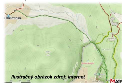
Ilustračný obrázok