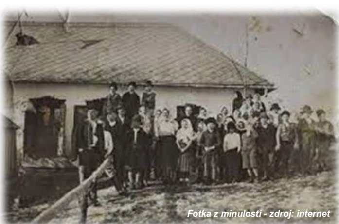
Fotka z minulosti

Cinobanské lazy sa okrem prírodných krás môžu pochváliť aj vyše storočnou raritou. Starú krčmu na Žihlave dal postaviť bývalý richtár 1.10.1878. Na starom drevenom tráme, ktorý