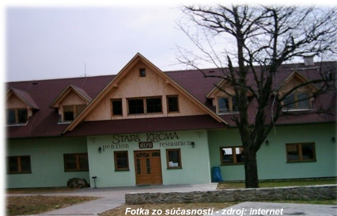
Fotka zo súčasnosti

Na základe informácií z internetu spracovala Bc. Miroslava Podhorová