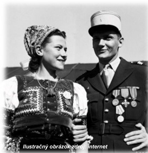
Ilustračný obrázok

V okolitých lesoch našli bezpečie počas bojov za slobodu. Mnoho odvážnych mužov a žien padlo v boji, o čom svedčia pietne