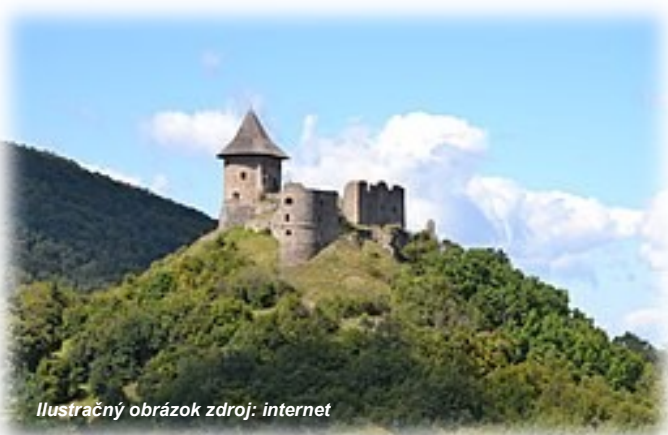
Ilustračný obrázok

Chránená krajinná oblasť Cerová vrchovina poskytuje množstvo zaujímavých miest, na ktorých si prídu na svoje nielen milovníci turistiky, ale aj záujemci o históriu či geológiu. Je to oblasť, ktorú formovala sopečná činnosť tzv. povrchových sopiek. Nakoľko príroda nepozná hranice, celá oblasť sa nachádza po oboch stranách slovensko-maďarskej hranice. Mám pochodené mnoho pohorí, ale v Cerovej vrchovine (za humnami) objavujem vždy nové a nové zaujímavosti. Za všetky spomeniem Šomošku so svojimi prírodnými zaujímavosťami, tak trochu divoký Pohanský hrad so skalnatými útesmi, kamenný Ragáč či Steblová skala pri Hajnáčke, ale aj na maďarskej strane hrad Salgó, rozhľadňu na Karancsi, Slivkový kopec (Szilvás-kő), rhyolitové pole v Kazári, obydlia